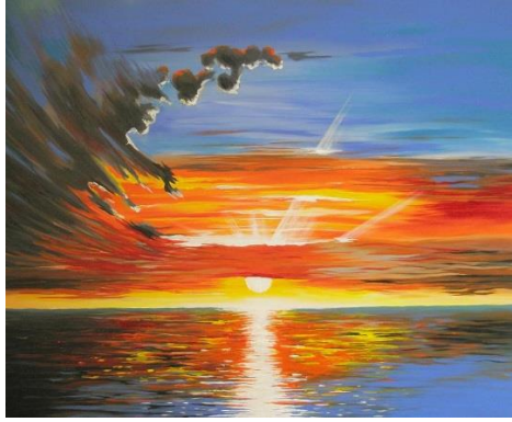
Dieva slavināšana vakarā (pēc Maghrib)

1- أَمْسَيْنَا وَأَمْسَى الْمَلِكُ لِلَّهِ وَالْحَمْدُ لِلَّهِ ، لَا إِلَهَ إِلَّا اللَّهُ وَحْدَهُ لَا شَرِيكَ لَهُ ، لَهُ الْمُلْكُ وَلَهُ الْحَمْدُ ، وَهُوَ عَلَى كُلِّ شَيْءٍ قَدِيرٌ ، رَبِّ أَسْأَلُكَ خَيْرَ مَا فِي هَذِهِ اللَّيْلَةِ وَخَيْرَ مَا بَعْدَهَا ، وَأَعُوذُ بِكَ مِنْ شَرِّ هَذِهِ اللَّيْلَةِ وَشَرِّ مَا بَعْدَهَا ، رَبِّ أَعُوذُ بِكَ مِنَ الْكَسَلِ وَسُوءِ الْكِبَرِ ، رَبِّ أَعُوذُ بِكَ مِنْ عَذَابٍ فِي النَّارِ وَعَذَابٍ فِي الْقَبْرِ . [مسلم 4/2088]